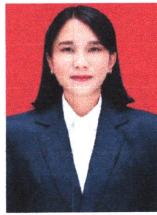
PUTRI RAMBUT SEBAHU