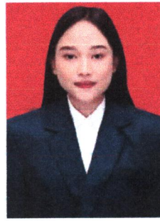
PUTRI RAMBUT PANJANG